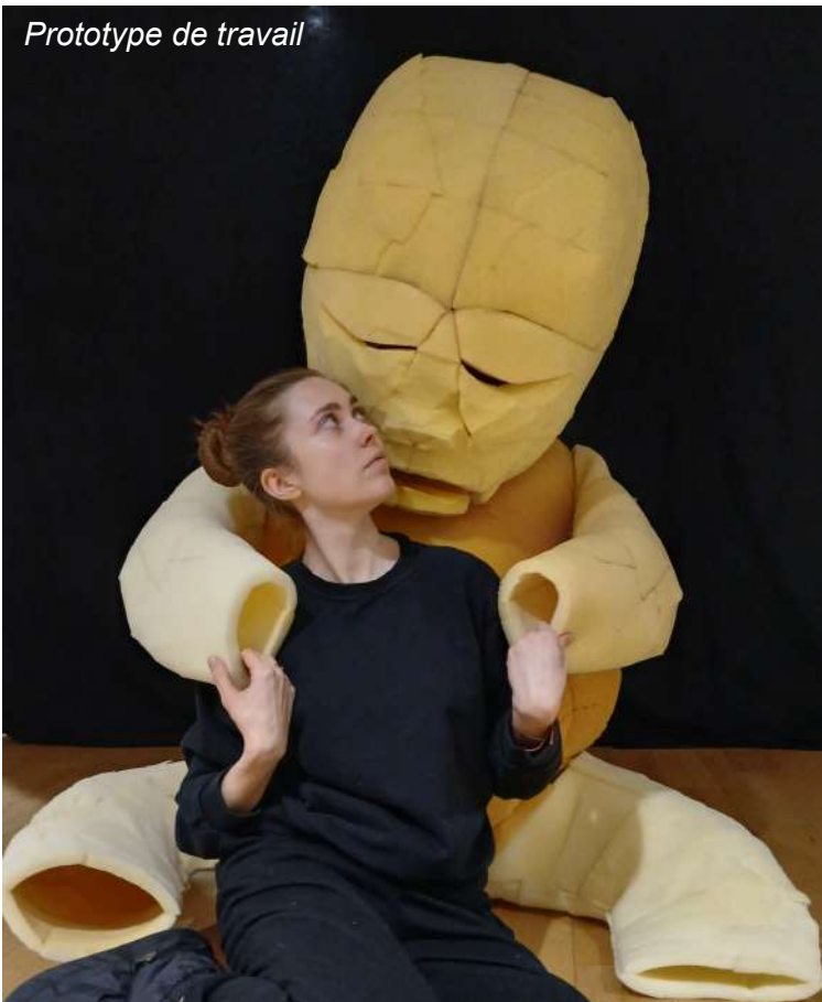
Prototype de travail