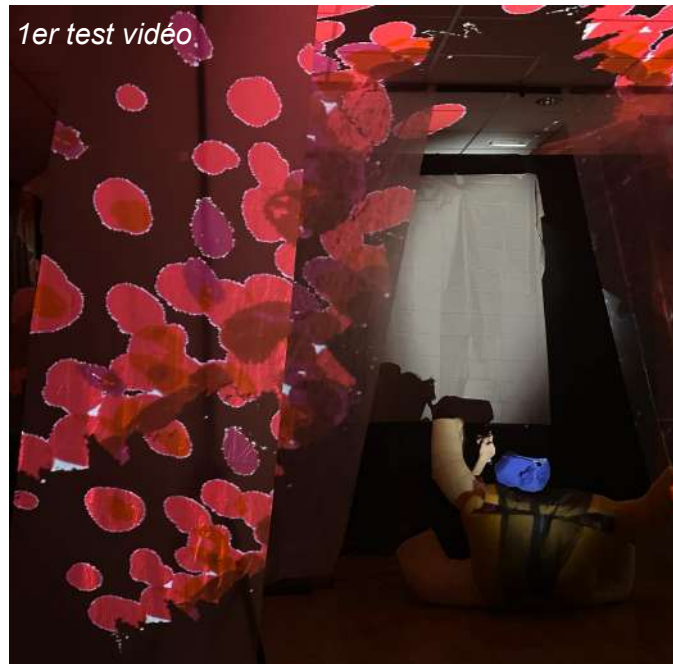
1er test vidéo